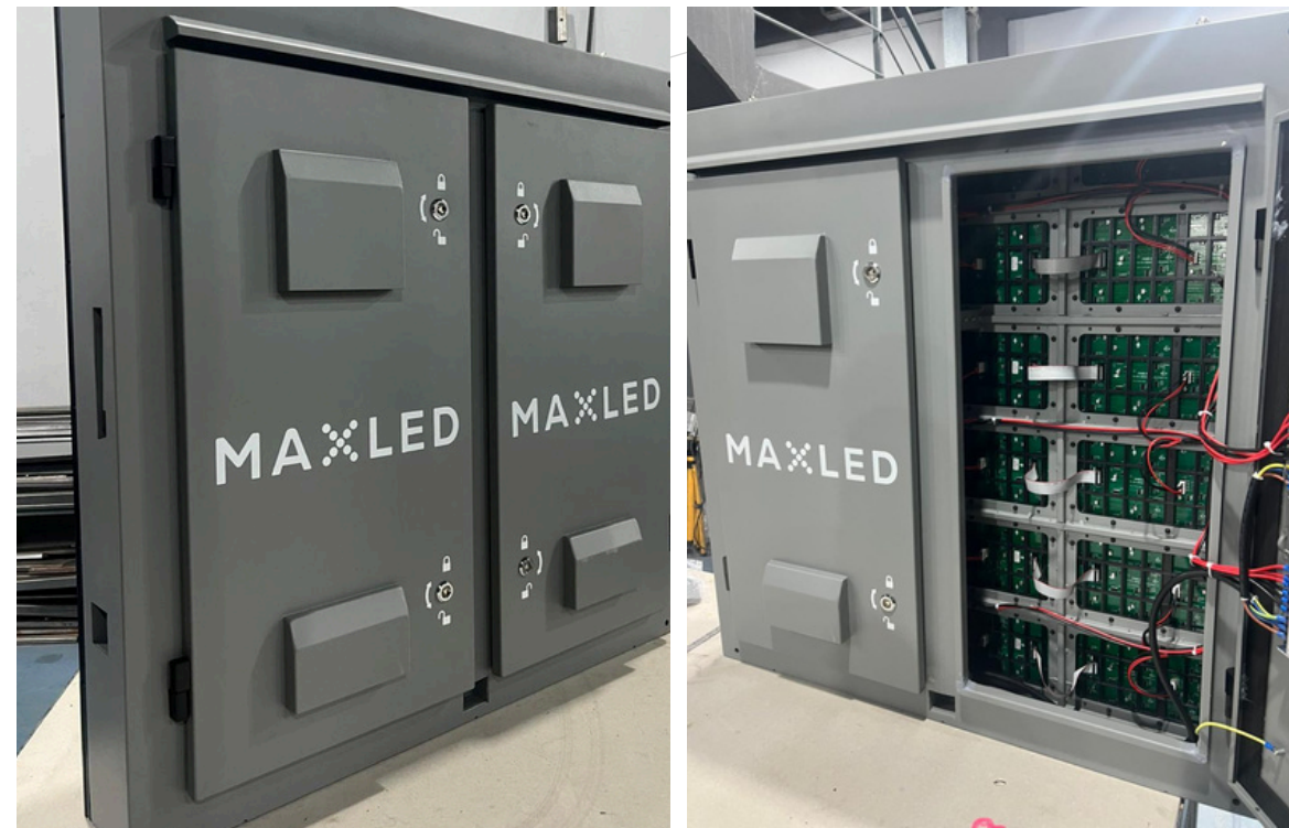
Medidas de Gabinetes: 960×960 mm

Diseño resistente al agua y polvo, con módulos de 320×160 mm que facilita instalación ágil, escalabilidad y mantenimiento eficiente en proyectos urbanos de gran escala.