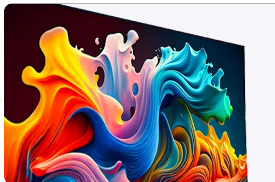
Imagen uniforme, colores vivos y ángulo de visión de 160° para máxima inmersión.